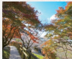
全てのコースのスタートはここから。手で触れられるほど間近で桜を楽しみながら遊歩道をゆっくりと散策できます。 住所: 豊田市小原町孫ハ456