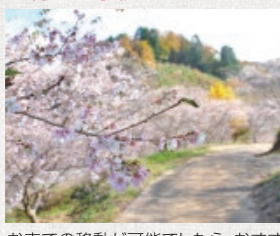
お車でのご移動が可能でしたら、おすすめの場所です。周辺にはウォーキングコースもあり、穴場スポットです。